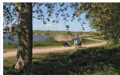
Op Koninginnedag werd dit wandelpad in Beneden-Leeuwen feestelijk geopend. De Heemkundevereniging doet het dagelijks onderhoud.

De nieuwe vereniging wil in de toekomst ook zorg gaan dragen voor het beheer van andere groene stukjes Leeuwen. Er is inmiddels contact gezocht met de vereniging Leeftol, die in Boven-Leeuwen Park Groenewoud wil aanleggen. Daarnaast gaat de club erop toezien dat er in de toekomst niet nóg meer monumentale panden en bomen verdwijnen uit beide dorpskernen.