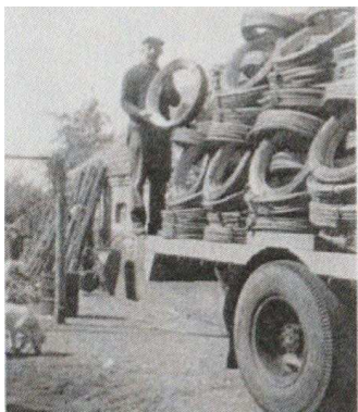
The de Weijert uit Boven Leeuwen, ("Theke deKoning") laadt hoepels voor verzending.

Roomboterfabriek "De Zon" aan de Steegsche straat (nu Bernhardstraat) en andere Maas en Waalse botterfabriekskes moesten hun vaten van elders betrekken, terwijl de hoepelmakers hun onderdelen naar o.a Oss (v.d.Berg en Jurgens met een eigen kuiperij) verzonden. Overleg en samenwerking zouden deze industrie eerder tot welvaart hebben gebracht dan het liberale "Spel van vrije krachten"!