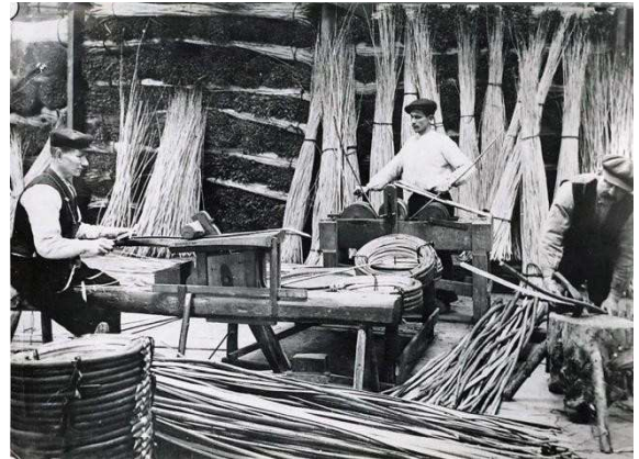
Hoepelmakerij Gebr. Van Halen in Boven Leeuwen was gevestigd op de hoek Kerkstraat (nu Willibrordusstraat) Florastraat