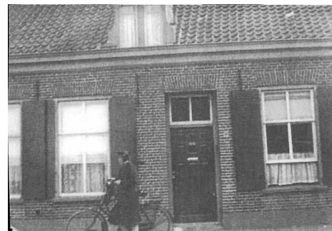
Huis van. Gelder-Bosmans Begijnenstraat Oss