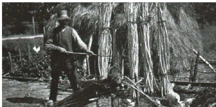
Het striepen (streupen) van de stokken

Als "grondstof" voor de hoepels werd griendhout (teenhout) gebruikt want het drassige Maas en Waalse land van toen was uitermate geschikt voor de teelt hiervan. Rond 1900 waren er in de gehele Gemeente Wamel 77 HA in gebruik voor de teelt van griendhout. Het hout dat gebruikt werd voor hoepels, werd nadat het van schors was ontdaan (bandstrieppen) gekloofd in twee of drie delen.