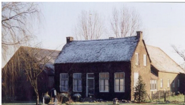
De boerderij van Van Sommeren aan de NoordZuid werd in februari 2002 gesloopt.

De tweede echtgenote van deze Adriaan Boesses was Anna Sibilla Hazelkamp geboren op 27 april 1751 te Negapatnam , overleden op 16 oktober 1809 te Leeuwen 58 jaar oud. Onze voorzichtige conclusie is dan ook dat de boerderij is gebouwd door Adriaan