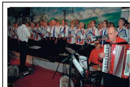
Ons eigen Lauws smartlappenkoor 'Trug in de Tèd' respecteert, evenals de Heemkundevereniging, de historie en wel door het zingen van nostalgische liederen.

Na afloop van de ledenvergadering (rond 20.00 u. ) treedt het smartlappenkoor Trug in de Tèd op. Iedereen die interesse heeft in de geschiedenis van Leeuwen en/of graag luistert naar dit bijzondere koor is van harte welkom bij dit optreden. De entree is gratis.