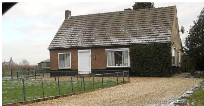
Geboortehuis in de Tesstraat, dat er nu nog staat