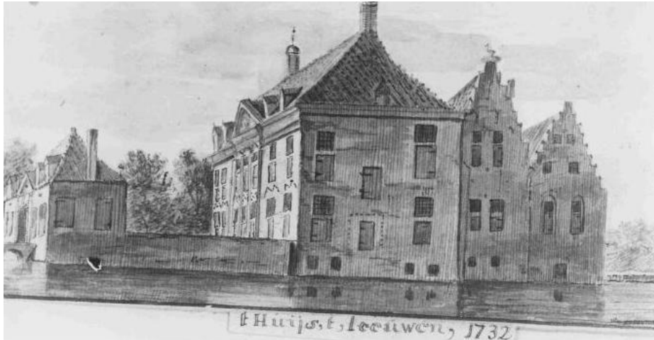
Huys te Leeuwen 1732

Als men van Leeuwen naar Druten de bochtige Waaldijk volgt, langs stille niet riet begroeide wielen binnendijks en smalle langgerekte plassen in de vette uiterwaarden. passeert men halverwege rechts. nabij de grensscheiding tussen beide gemeenten de plaats van het voormalige 'Huys' te BovenLeeuwen.