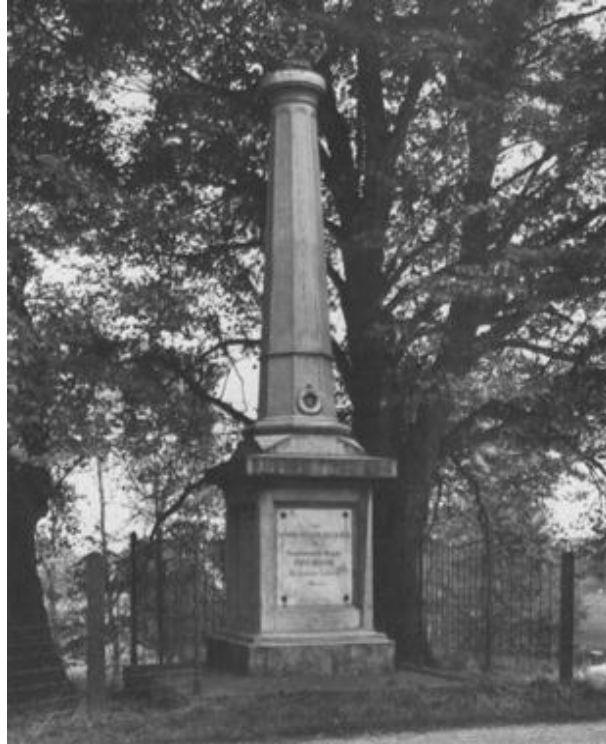
Het monument na renovatie 1893 (opname 1975)

Tegen de binnenzijde van de Waalbandijk tussen de Wielstraat en de Korte Brouwerstraat staat een in 1893 vernieuwde gedenknaald, die een uit 1874 daterend monument vervangt, dat de herinnering levend houdt aan de watersnoodramp van 1861